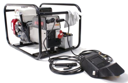
EP200X1 / (FULLOP)