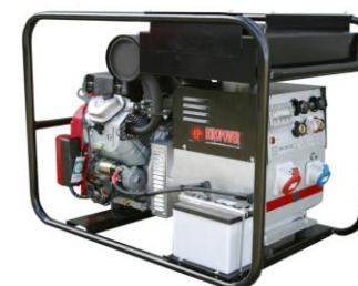
EP250XE / 300XE