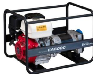
EA6000 / AVR