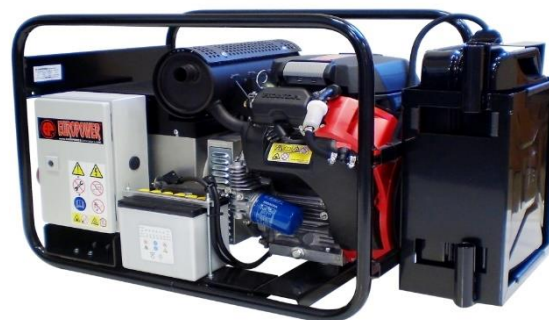
EP13500TE/TE AVR EP16000TE/TE AVR EP18000TE/TE AVR