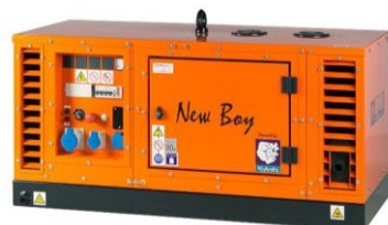
EPS113TDE / EPS183TDE