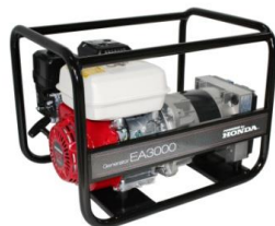
EA3000 / AVR